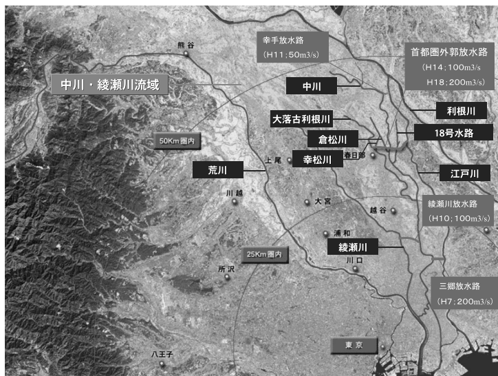
図1 中川・綾瀬川流域図

本稿では、関東地方整備局の土木工事で初めての契約方式となる「設計・施工一括発注方式（デザインビルド方式）」を採用した「大落古利根川連