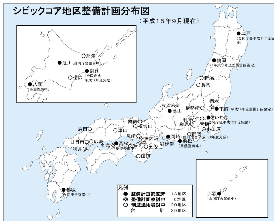
図 1 シビックコア地区整備計画の分布

平成15年8月29日には制度改定後の全国第1号として、岐阜県高山市により、高山市の中心市街地のまちづくり計画である「高山市シビックコア地区整備計画」が策定され、中部地方整備局の同意を受けています。