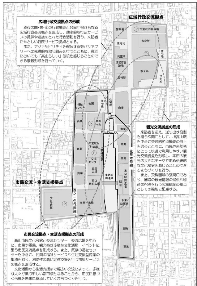
図 3 高山市シビックコア地区の区域