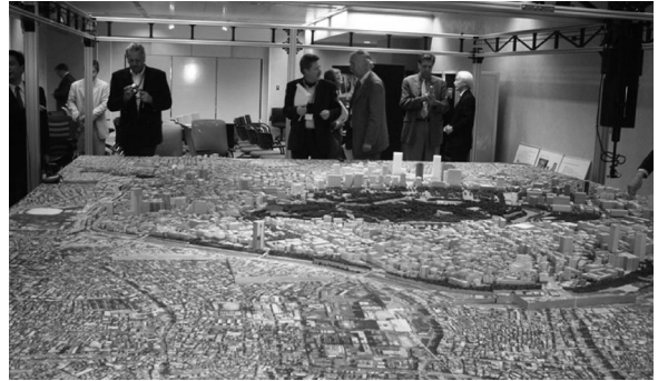
丸の内開発の説明風景