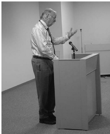
参加者からの発言風景

いてで、海外からの参加者の皆さんに深く関心をいただいていたいただき、オランダからの参加者が、講演に触発されて俳句を披露される