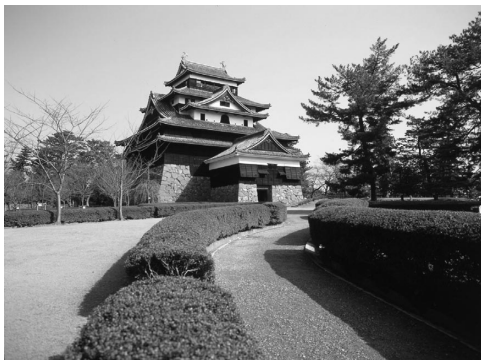
2011年に築城400年を迎える松江城