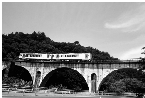
写真 2 宮守川橋梁