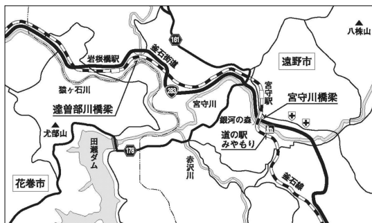
図 2 橋梁位置図

終戦後の脆弱な財政の中で釜石線工事再開の契機となったのは、昭和23(1948)年のアイオン台風である。山田線が寸断し、宮古～釜石間の海岸地方は陸の孤島と化したためである。検討の結