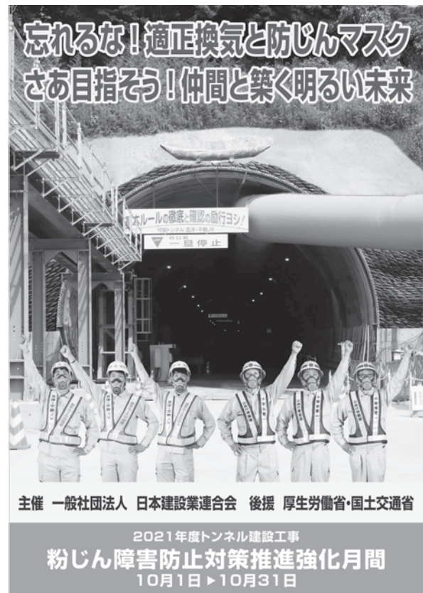
図-2 「粉じん障害防止対策推進強化月間」ポスター