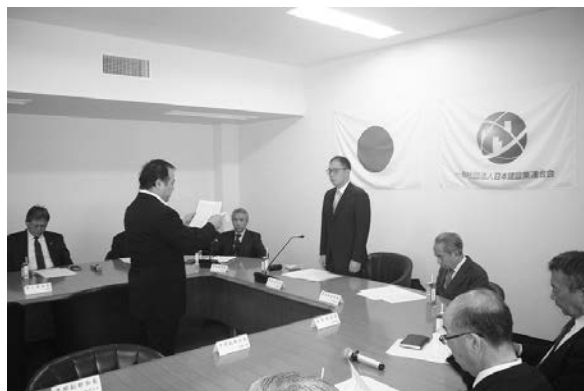
写真-2 交通対策部会 表彰式