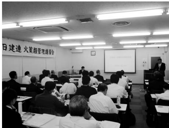
写真-1 火薬類対策部会 講習会

これ以外にも事故防止講習会等の開催、各種の現場用教育資料の新規作成や改訂、交通安全懸垂幕、地下埋設物安全旬間ポスター、環境啓発ポスター等の作成、配布等の活動を行っています(写真-1, 2)。