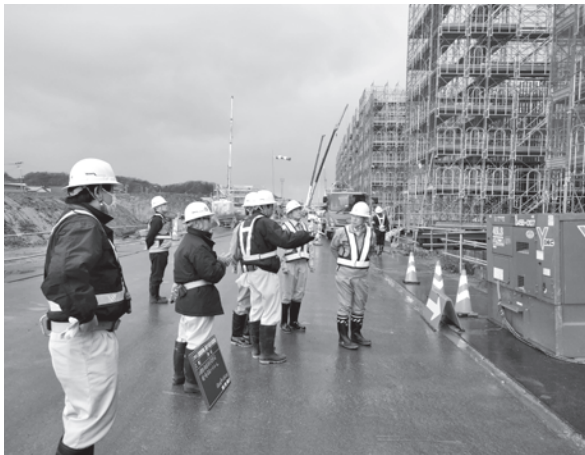
写真-3 現場安全パトロール

りも重要な課題と考えており、次に示すとおり、発注機関との連携を図りつつ、鉄道現場に軸足を置いて展開しています。