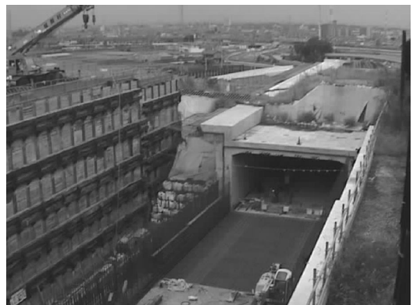
写真 2 モニターから見た建設現場の映像

他の工事についてもアンケートを行うなど、本取り組みの効果や課題を把握・分析することにより、建設現場のオープン化の本格実施に向け、実施手法等を検討して参ります。