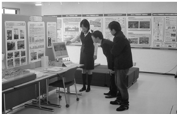
写真 1 建設現場のモニター映像を市民へ公開(外かんインフォメーションセンターのモニター矢切(関東地方整備局 首都国道事務所))

今回のアンケート結果では、現場のオープン化の目標である「工事施工状況の把握への活用など監督業務の補助的効果」や「事業に対する理解の向上が図られる」について一定の効果があることが分かりました。今後は、引き続き