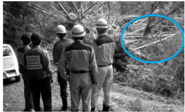
写真-4 電柱・倒木除去のための現地調査 ※囲み箇所は、倒木によって倒された電柱

千葉県内各地で停電が発生したが、送電線の復旧にあたり倒木等が支障となり現場への到着が困難だったことから、関係機関と協力し、市道等の道路啓開を支援し、早期の停電解消に貢献した(写真-4)。