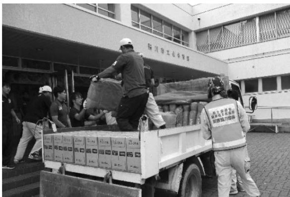
写真-3 物資支援状況 (千葉県鴨川市)

物資の供給には、地方整備局をはじめ、日本建設業連合会、各種災害協力団体、水資源機構等の協力を得て、速やかな支援を実施した(写真-3)。