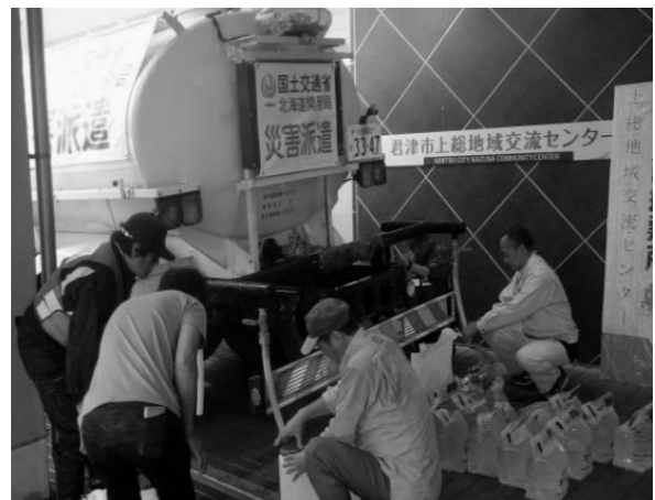
写真-5 給水支援状況 (千葉県君津市)

この台風により断水となった千葉県君津市等の避難所等に、散水車を11台派遣し、給水支援を実施した(写真-5)。