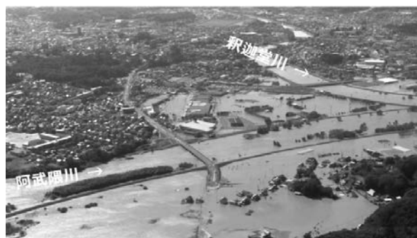
写真-2 阿武隈川における浸水被害

河川被害としては, 国管理河川で12カ所, 県管理河川で128カ所において堤防が決壊し, 国管理河川のみでも最大約25,000haの浸水等が発生したが, 11月時点で全ての仮堤防が完成している(写真-2)。土砂災害件数は, 台風に伴う災害としては過去最大の953件であった(11月18日時点)。