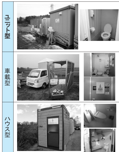
図一 平成27年度 モデル工事において導入した仮設トイレのタイプ