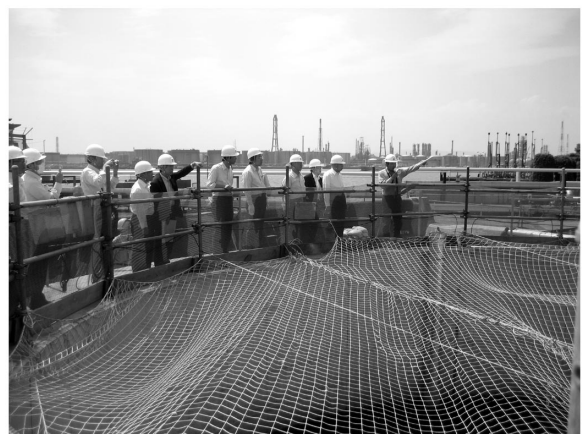
写真 1 現地視察状況