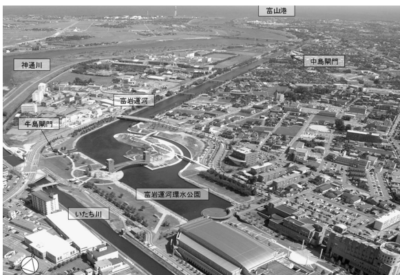
写真 1 富岩運河全景

平成22（2010）年4月からは、最上流にある富岩運河環水公園から河口付近の岩瀬運河を結ぶ富岩水上ラインの運航に使われ、新たな観光スポットとなっています。