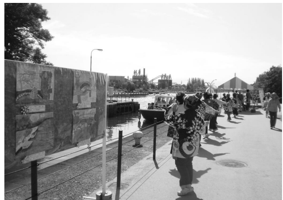
写真 6 運河まつり

また、地域住民等で組織されている「運河のまちを愛する会」（平成16年設立）によるイベント（運河まつり）が開催されるなど、富岩運河の利活用が図られています。