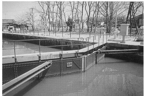
写真 3 門扉のリベット

門扉の主要部材は、普通鋼によるスキンプレート・横桁・立桁で構成され、今ではめずらしいり