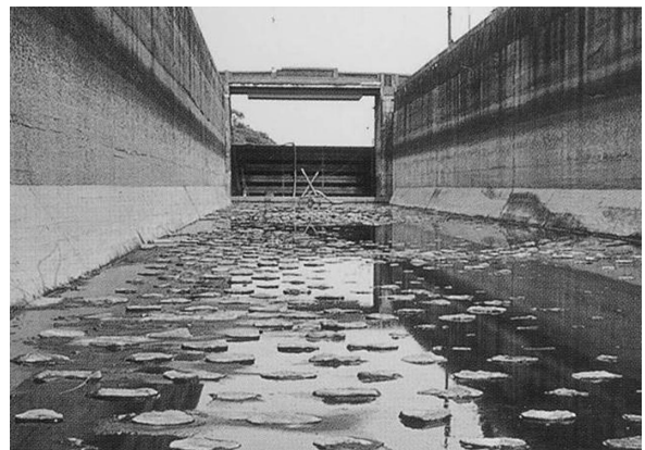
写真 2 閘室底部の玉石

閘室は、長さ約60m、幅約9m、深さ約6.3mで、石組み・鉄筋コンクリート造りとなっており、底部表面には半割の玉石が千鳥状に配置されています。