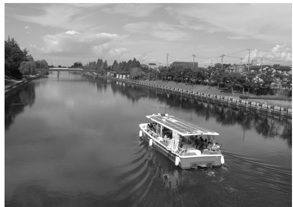
写真 5 ソーラー船「sora」

「富岩水上ライン」として、都心のオアシス「富岩運河環水公園」から「中島閘門」を経て、港町「岩瀬」までを二酸化炭素を排出しない環境に優しいソーラー船「sora」と電気ボート「もみじ」が案内しています。