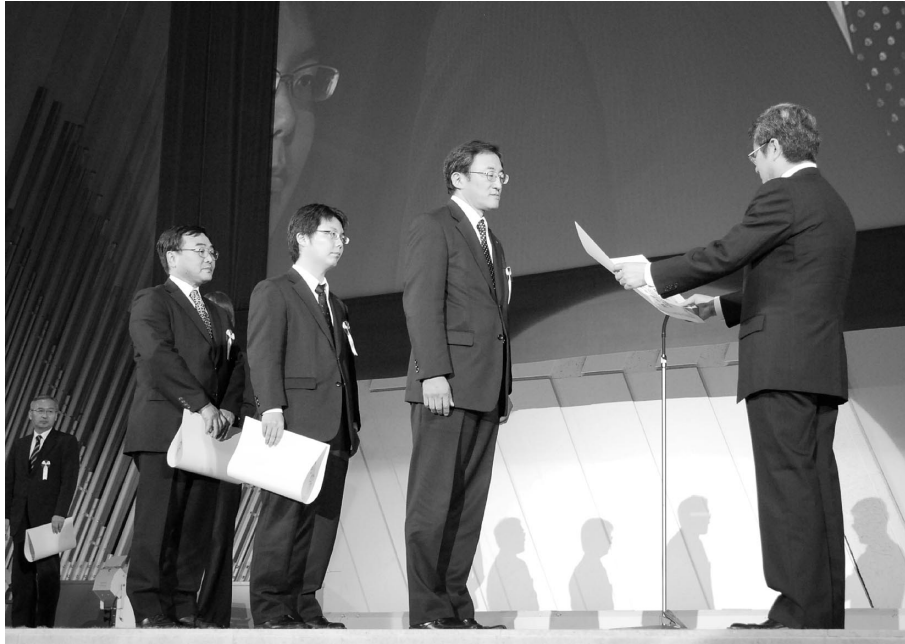
写真 2 表彰式の様子