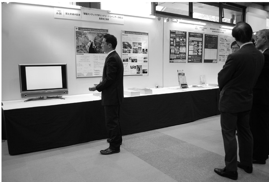
写真 3 展示の様子