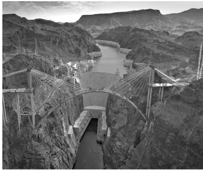
写真 1 コロラドリバー橋周辺の風景

さらに、歴史的建造物であるフーバーダムと同一素材のコンクリートアーチ橋の架橋により、新たな景観創出と観光資源としての価値を向上させたこと、物流ルートと観光ルートを分離することで、慢性的交通渋滞を緩和し、地域経済の活性化に寄与したこと等も高く評価された（写真 1、図 1）。