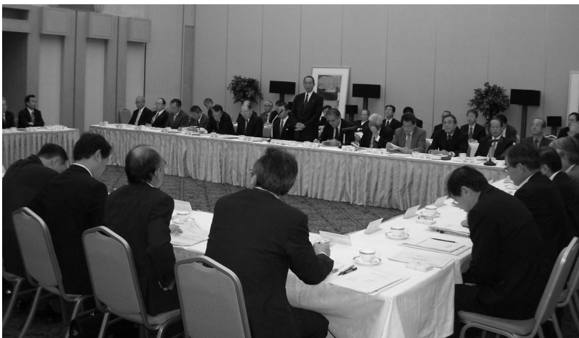
写真 1 意見交換会（九州地区）