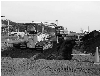
建設機械運転基礎コース