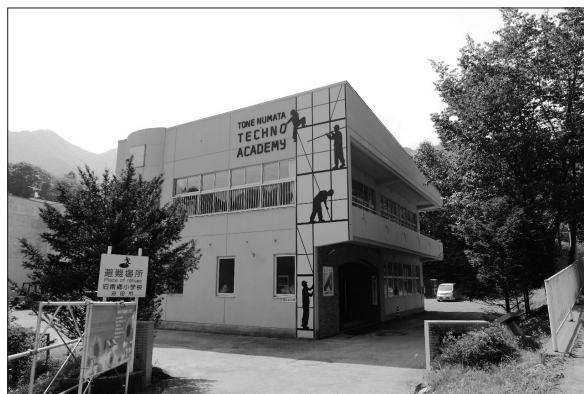
写真-1 利根沼田テクノアカデミー外観

当アカデミーは、きちんとした教育を行うことで訓練を終えて現場に出たときに即戦力となれる力を授けます。現場の中での「ながら教育」に比べて、遥かに効率良く育成できることが特徴です。職人自身も現場で力を発揮できるため、早期に仕事の面白さに気付くことができ、離職率も大幅に減少します。