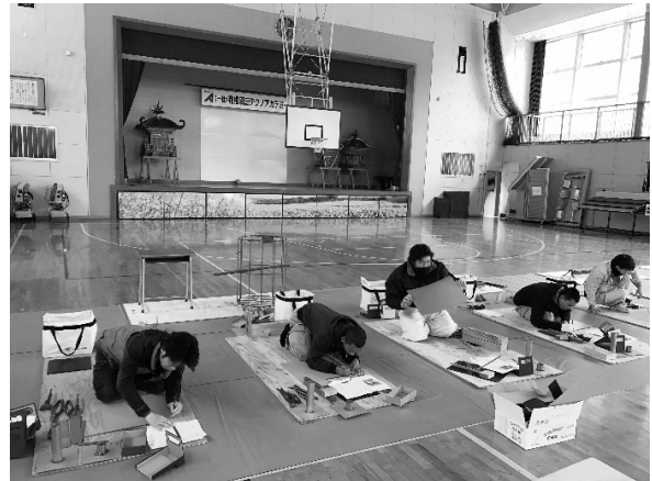
写真-2 工作訓練の様子

ひとつです。講師から合格をもらえるまで課題達成とはなりません。同期の仲間同士が助け合い、より良い方法を模索して完成を目指します。創意工夫や仲間との連携など、学べるものが非常に多い訓練となっています(写真-2)。