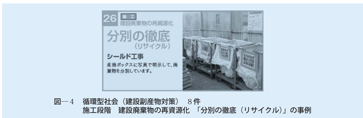
図一4 循環型社会 (建設副産物対策) 8件 施工段階 建設廃棄物の再資源化 「分別の徹底 (リサイクル)」の事例