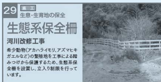
図一5 自然共生社会（生物多様性の保全） 7件 施工段階 生息・生育地の保全 「生態系保全柵」の事例