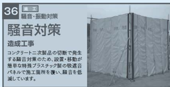
図一6 建設公害防止（建設公害の防止） 8件 施工段階 騒音・振動対策 「騒音対策」の事例